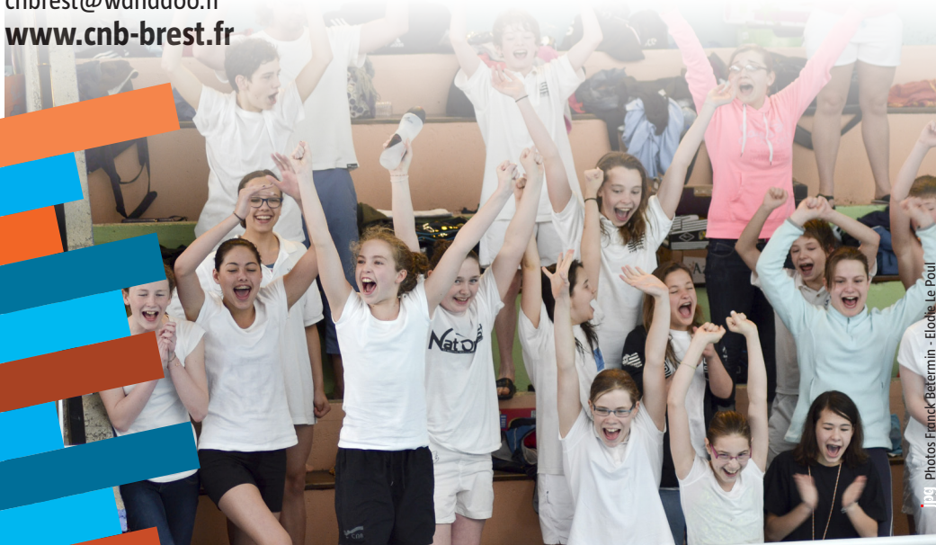
Jpg Photos Franck Béarmin - Elodie Le Poul